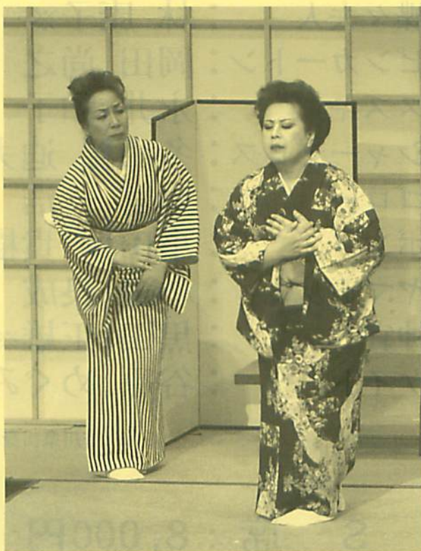
「林康子ふるさとに歌う」(2006年)舞台写真

若手演出家・井原広樹氏の演出により、世界的ソプラノ歌手・林康子さんが蝶々夫人を演じます。1972年、イタリア・スカラ座で日本人として初めてタイトルロールを演じて以来、林康子さんの代表的作品です。